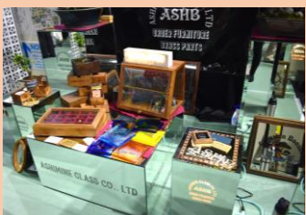
有限会社安次嶺ガラス