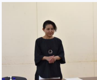
洋菓子・パン工房 グラシュエ