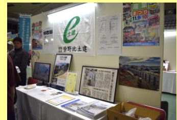
有限会社栄野比土建