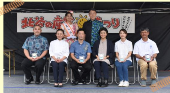
産業まつりにて表彰されました☆

第20回町産品コンテストについて6月10日～7月1日までの期間公募し、厳選な審査の結果、7点の町産品が選ばれました。 町産品の表彰式は11月9日の北谷の産業まつりにて行われ、来場者に向けて広くPRを行いました。