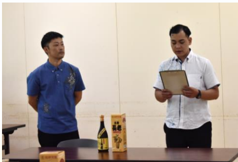
北谷長老酒造工場株式会社