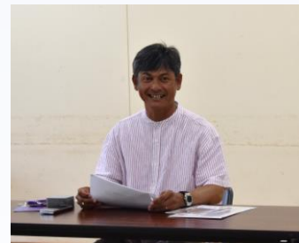
合同会社パレットリンク沖縄