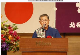
来賓祝辞 仲地泰夫議長