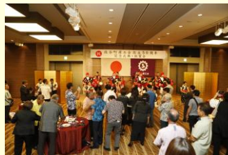
余興 栄口区青年会