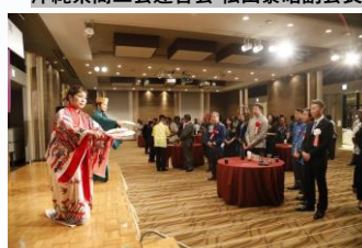
祝賀会幕開け 女性部