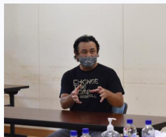
ブルーランジェリー エピドゥブレ