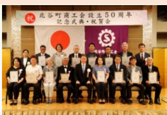
役員特別功労賞、役員功労賞、 50年会員企業功労賞