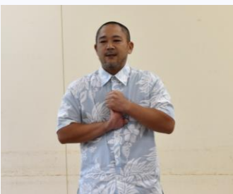
ケーキショップアントルメ