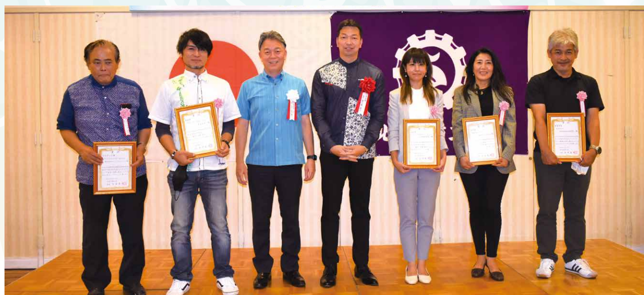
➡ 町産品コンテスト ◀