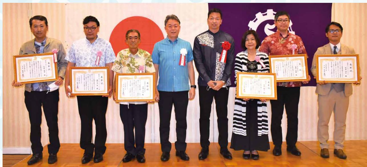
➡ 優良従業員表彰 ◀