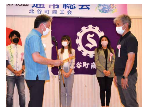
町産品コンテスト表彰