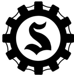
北谷町商工会 特設ページ

産直お取り寄せ EC サイト「ニッポンセレクト」に「北谷町商工会 特設ページ」を作成し、販売を行う。