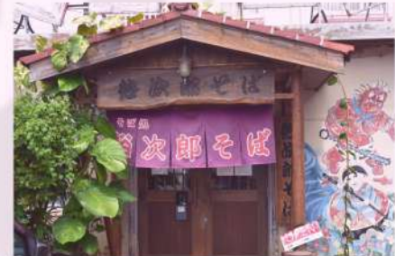
裕次郎そば 北谷町字北前1-11-11 ☎098-936-6886 業種：食堂（沖縄そば他）