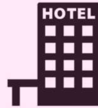
有限会社 やんばるフォレスト 北谷町字宮城3番地223 ☎098-979-5755 業種：ホテル