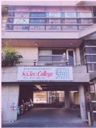
学校法人 南西学園 北谷町美浜1-5-16 ☎098-926-1800 業種：専門学校