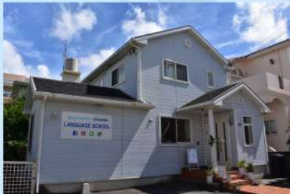
月ぬ合同会社 北谷町字宮城3-149 ☎098-953-7206 業種：英会話教室