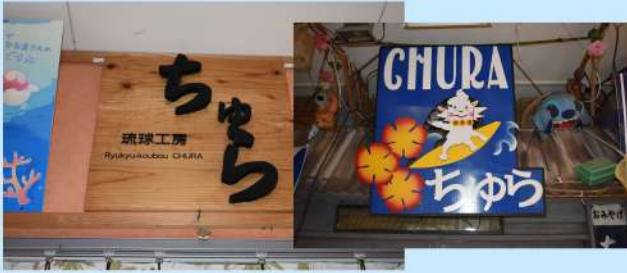
琉球工房 ちゅら 北谷町美浜15-69 カーニバルパーク2F ☎098-894-2780 業種：お土産等販売